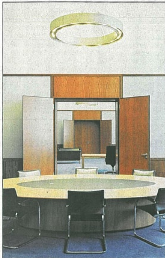
TÜREN AUS RENCHEN: Im Wirtschaftsministerium gehen Mitarbeiter und Gäste durch Joro-Türen in die Konferenzräume.